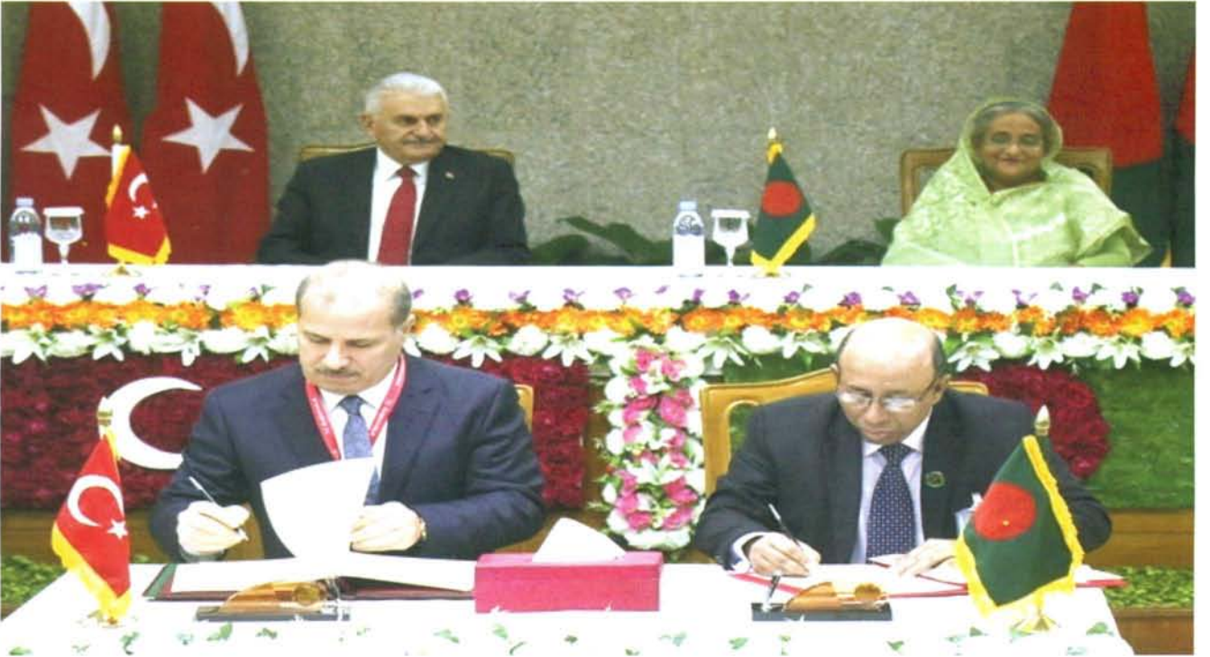
বাংলাদেশের প্রধানমন্ত্রী শেখ হাসিনা এবং তুরস্কের প্রধানমন্ত্রী বিনালি ইলদিরিম এর উপস্থিতিতে বিএসটিআই এবং টিএসই-এর মধ্যে পণ্যের মাননিয়ন্ত্রণ বিষয়ে সমঝোতা স্মারক স্বাক্ষর