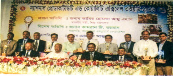
ন্যাশনাল প্রোডাক্টিভিটি অ্যান্ড কোয়ালিটি এক্সিলেন্স অ্যাওয়ার্ড-২০১৬ প্রদান অনুষ্ঠান