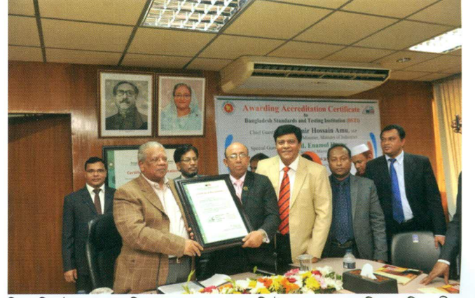
বিএসটিআই এর মহাপরিচালকের হাতে এ্যাক্রেডিটেশন সনদ তুলে দিচ্ছেন শিল্পমন্ত্রী।