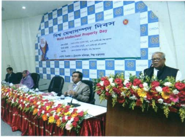
বিশ্ব মেধাসম্পদ দিবস-২০১৮ উপলক্ষে আয়োজিত সেমিনারে বক্তব্য রাখছেন শিল্পমন্ত্রী আমির হোসেন আমু।