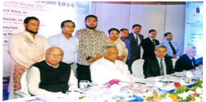
বিসিকের সার্বজনীন আয়োডিনযুক্ত লবণ প্রকল্পের উদ্যোগে আয়োজিত অনুষ্ঠানে শিল্পমন্ত্রী আমির হোসেন আমু ও স্বাস্থ্যমন্ত্রী মোহাম্মদ নাসিম