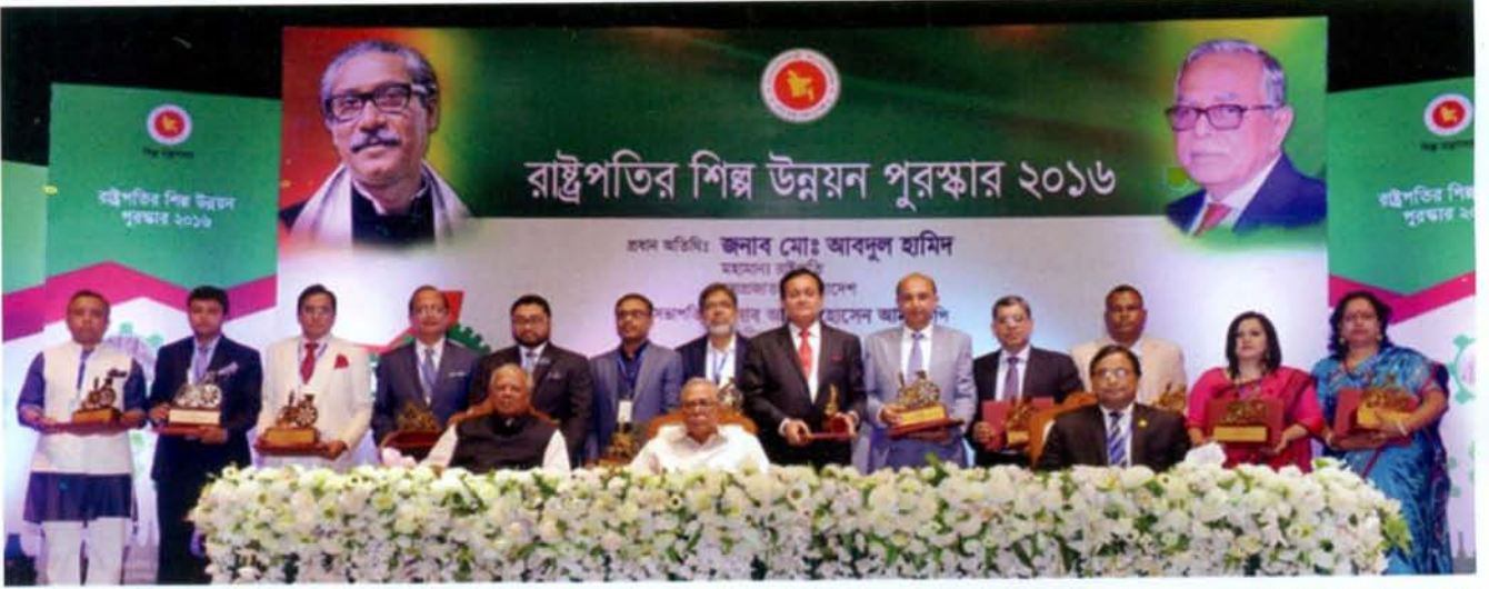
ঢাকায় ওসমানী স্মৃতি মিলনায়তনে 'রাষ্ট্রপতির শিল্প উন্নয়ন পুরস্কার-২০১৬' প্রদান অনুষ্ঠানে পুরস্কারপ্রাপ্ত প্রতিষ্ঠানের প্রতিনিধিদের মাঝে মহামান্য রাষ্ট্রপতি মোঃ আবদুল হামিদ