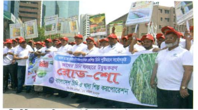
দেশীয় চিনির প্রচারে বিএসএফআইসি'র উদ্যোগে বর্ণাঢ্য 'রোড-শো'।