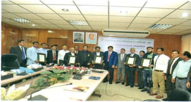
বিএবি'র অ্যাক্রেডিটেশন সনদ বিতরণ অনুষ্ঠানে শিল্পসচিব