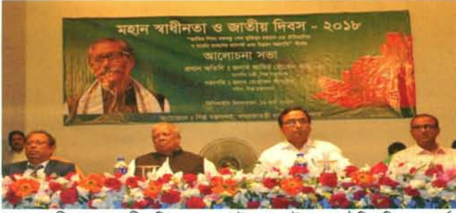
'মহান স্বাধীনতা ও জাতীয় দিবস-২০১৮' উদযাপন উপলক্ষে ঐতিহাসিক ৭ মার্চের ভাষণের তাৎপর্য এবং উন্নয়ন অগ্রগতি' শীর্ষক শিল্প মন্ত্রণালয় আয়োজিত আলোচনা সভা