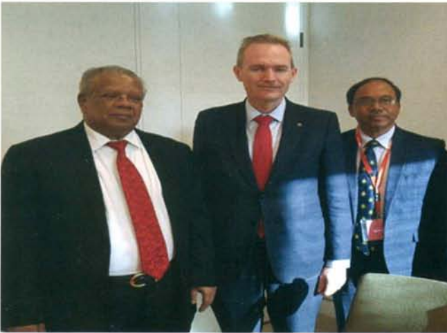
অস্ট্রেলিয়া সফররত শিল্পমন্ত্রী আমির হোসেন আমুর সাথে অস্ট্রেলিয়ার সহকারী অর্থমন্ত্রী ডেভিড কোলম্যান

বাংলাদেশের চলমান উন্নয়ন অভিযাত্রায় অস্ট্রেলিয়ার সহযোগিতা অব্যাহত থাকবে বলে জানিয়েছেন দেশটির সহকারী অর্থমন্ত্রী ডেভিড কোলম্যান। তিনি বলেন, দক্ষিণ এশিয়ায় দ্রুত ও টেকসই আর্থসামাজিক অগ্রগতির ক্ষেত্রে বাংলাদেশ নতুন উদাহরণ সৃষ্টি করেছে। অস্ট্রেলিয়া সফররত শিল্পমন্ত্রী আমির হোসেন আমুর সাথে বৈঠককালে ডেভিড কোলম্যান এ কথা বলেন। ক্যানবেরার ফেডারেল সংসদ কার্যালয়ে গত ০৮ মে এ দ্বিপাক্ষিক বৈঠক অনুষ্ঠিত হয়। বৈঠকে তারা বাংলাদেশ ও অস্ট্রেলিয়ার মধ্যে দ্বিপাক্ষিক স্বার্থ সংশ্লিষ্ট বিষয়ে আলোচনা করেন। এ সময় দু'দেশের মধ্যে বাণিজ্য বৃদ্ধি, বিনিয়োগ সম্পর্ক জোরদার, প্রযুক্তি হস্তান্তর ও জনগণের সাথে যোগাযোগ বৃদ্ধির বিষয়ে আলোচনা হয়। বৈঠকে শিল্পমন্ত্রী বলেন, প্রধানমন্ত্রী শেখ হাসিনার গতিশীল নেতৃত্বে সাম্প্রতিক বছরগুলোতে বাংলাদেশে দৃঢ় অর্থনৈতিক প্রবৃদ্ধি ও সামাজিক অগ্রগতি সূচিত হয়েছে। তিনি অস্ট্রেলিয়ার বাজারে বাংলাদেশি পণ্যের বিশেষ সুবিধা দেয়ায় সে দেশের সরকারকে ধন্যবাদ জানান। আগামী দিনে দ্বিপাক্ষিক ব্যবসা-বাণিজ্য ও অর্থনৈতিক অংশীদারিত্ব নতুন উচ্চতায় পৌঁছাবে বলে তিনি আশা প্রকাশ করেন। আমির হোসেন আমু বলেন, পণ্য উৎপাদনের ক্ষেত্রে অস্ট্রেলিয়ার অভিজ্ঞতা বাংলাদেশে শিল্পখাতের গুণগতমান বৃদ্ধি, মান