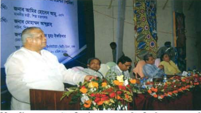
বিসিক বার্ষিক সম্মেলন-২০১৮ উদ্বোধনী অনুষ্ঠানে বক্তব্য রাখছেন শিল্পমন্ত্রী আমির হোসেন আমু এমপি