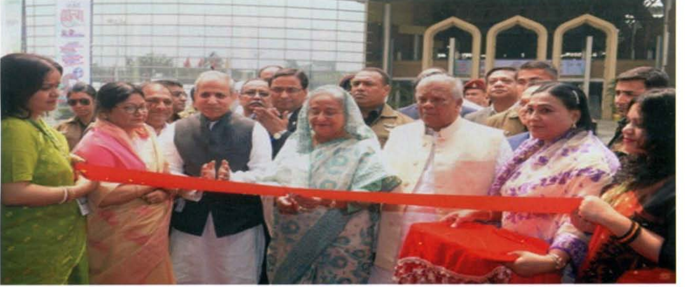
ঢাকায় বঙ্গবন্ধু আন্তর্জাতিক সম্মেলন কেন্দ্রে '৬ষ্ঠ জাতীয় এসএমই মেলা' এর উদ্বোধন করেন প্রধানমন্ত্রী শেখ হাসিনা।