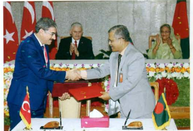
এসএমই ফাউন্ডেশন এবং তুরস্কের স্মল অ্যান্ড মিডিয়াম এন্টারপ্রাইজেস ডেভেলপমেন্ট অর্গানাইজেশন মধ্যে সমঝোতা স্মারক স্বাক্ষর